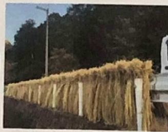
大切なもち米の藁を天日干し