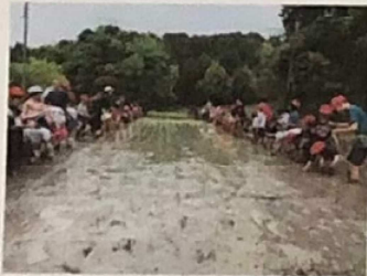
小学校で田植え体験