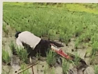
田面ライダーで溝切。泥にもめげず