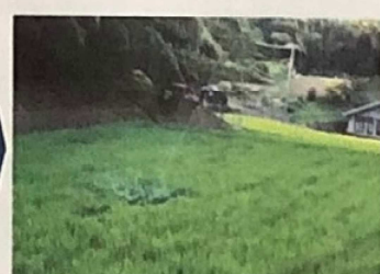
ドローンで消毒。楽チン